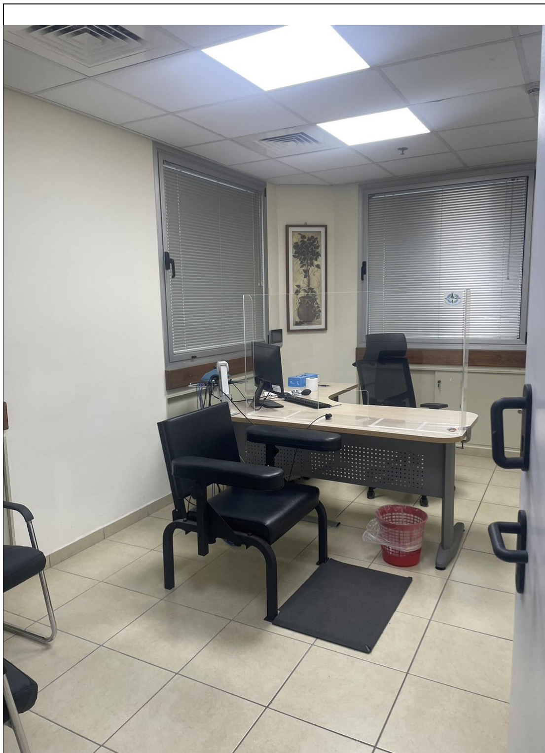
特拉維夫警察局測謊室內部情形，窗戶僅能往上開