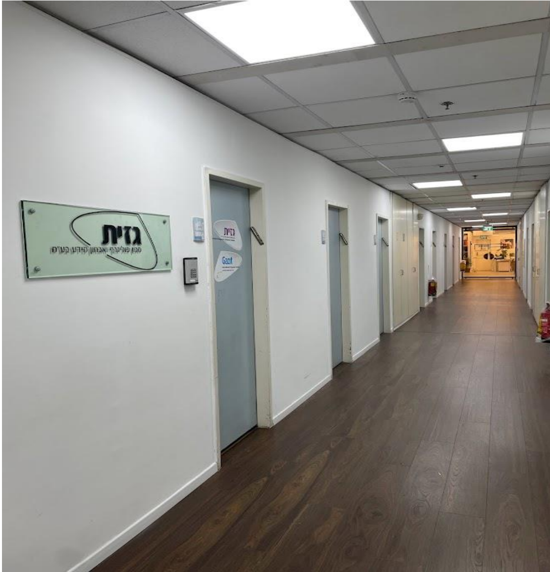
位於以色列特拉維夫的國際測謊機構外觀