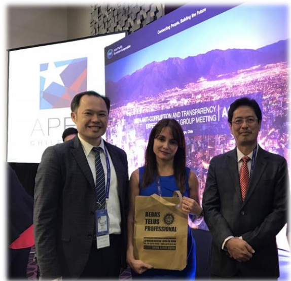
上：ACTWG 第 28 次會議全體經濟體合影 右：我國代表參加 ACTWG 會議與簡報情形 左：我國代表、2019 年智利主席(中)與馬來西亞代表(右)合影