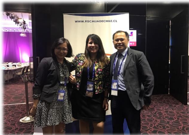
左上：我國代表與韓國代表合影