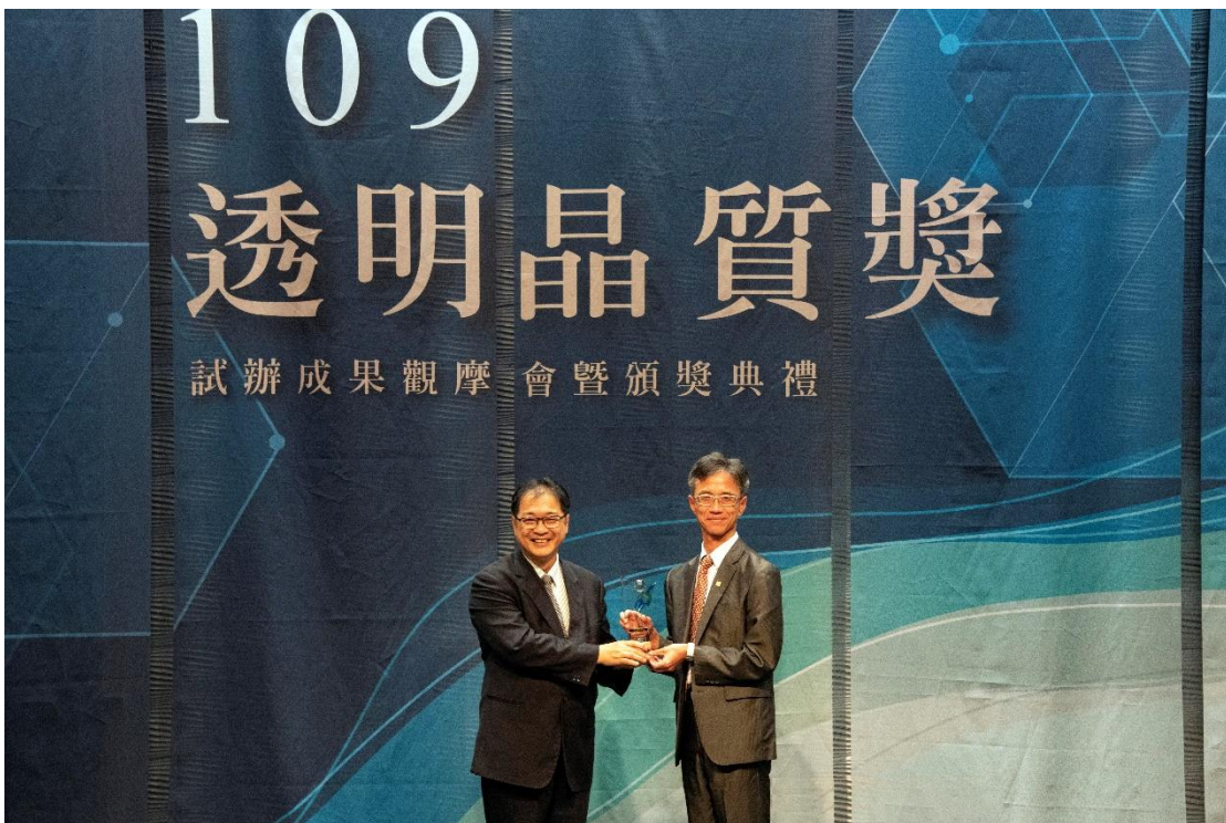
圖 3 受獎機關 臺中市政府地方稅務局沈政安局長