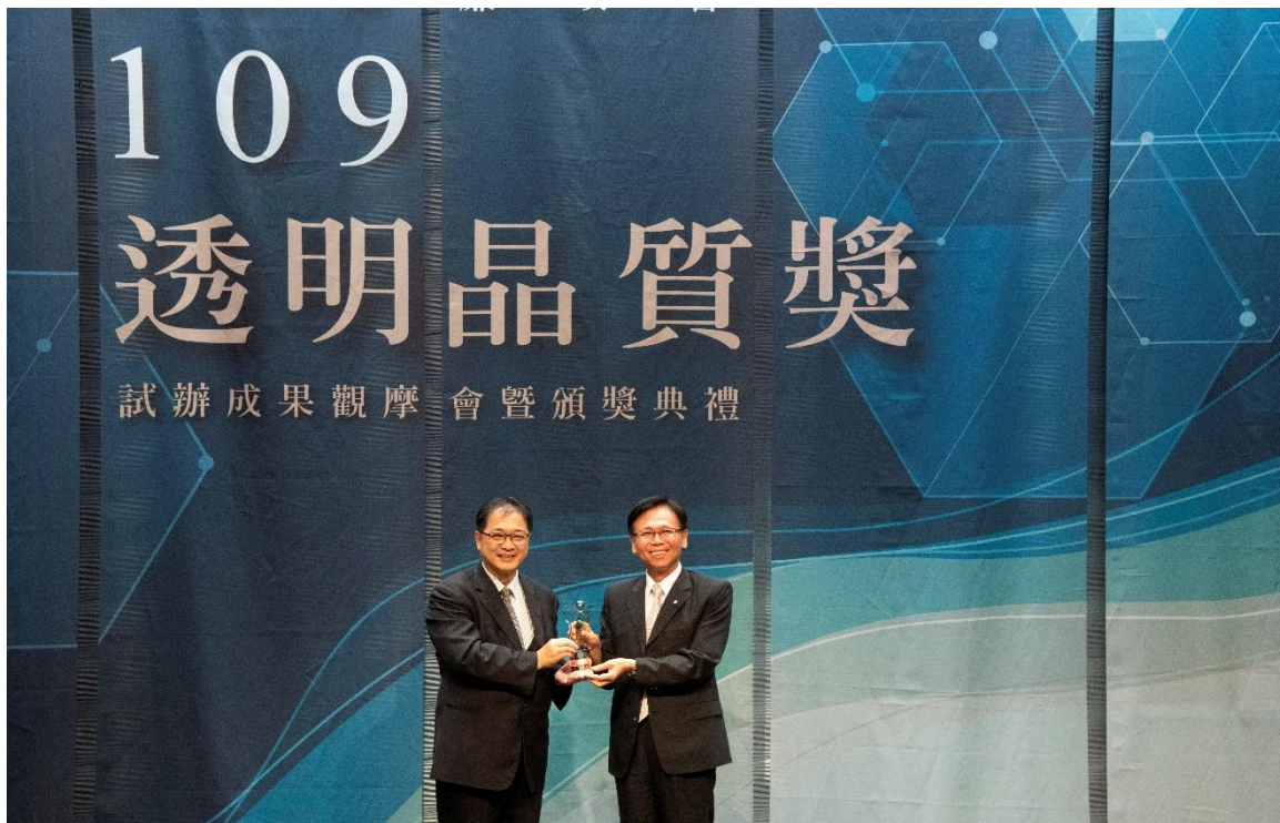
圖 2 受獎機關 新竹市政府警察局鄧學鑫局長