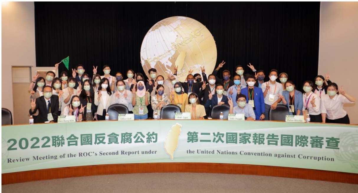
編號 1：8 月 30 日 UNCAC 第二次國家報告國際審查會場合影