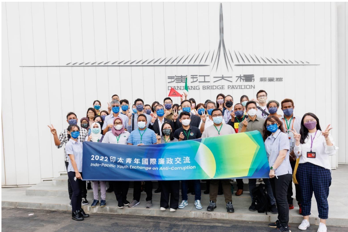
編號 5：9 月 1 日交通部公路總局淡江大橋願景館合影