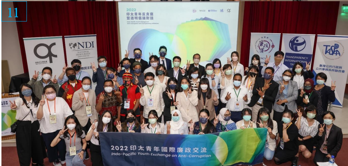
編號 9、10、11：9 月 2 日印太對話分享及與談人合影