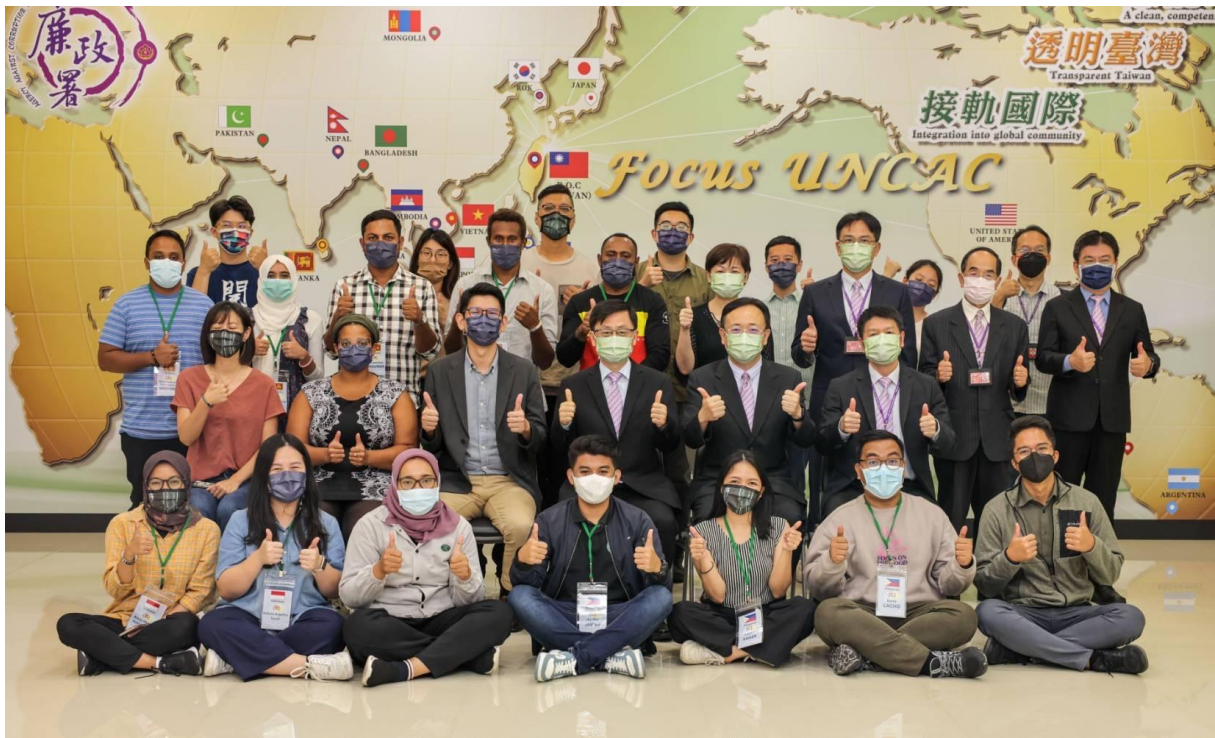
編號 7：9 月 1 日法務部廉政署參訪活動合影