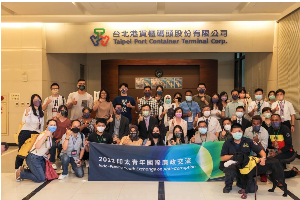
編號 6：9 月 1 日財政部關務署基隆關臺北港參訪活動合影