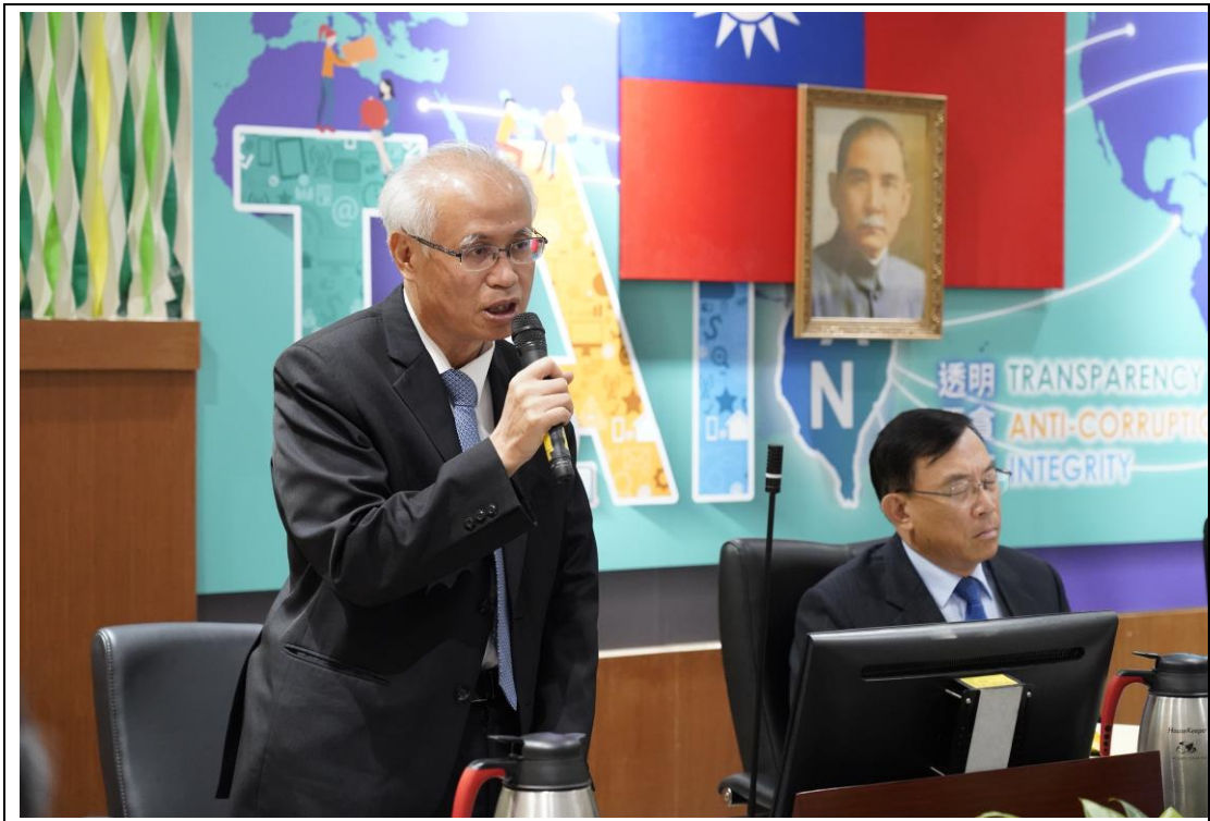
臺灣高等檢察署張檢察長斗輝致詞