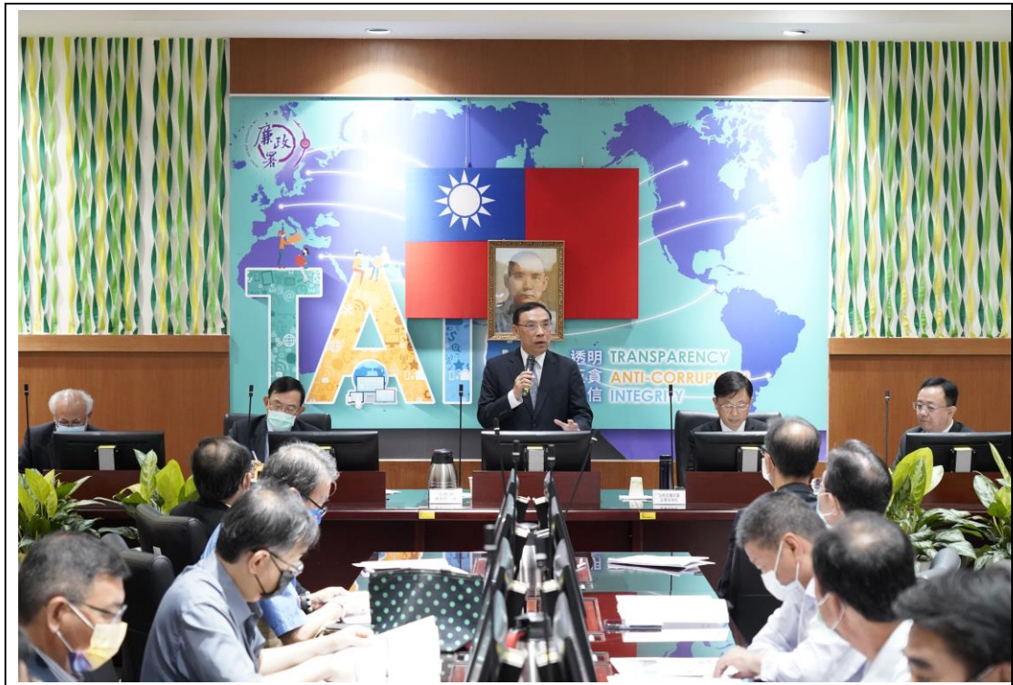
法務部蔡部長清祥致詞