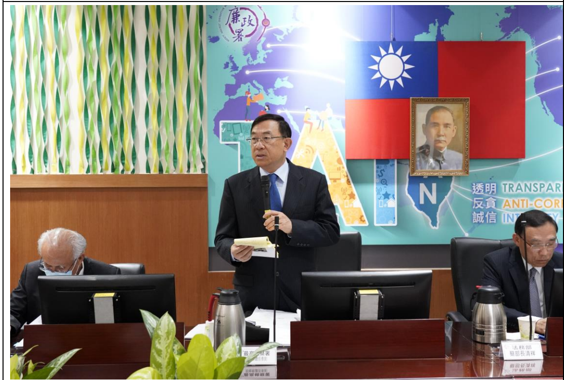
最高檢察署邢檢察總長泰釗致詞