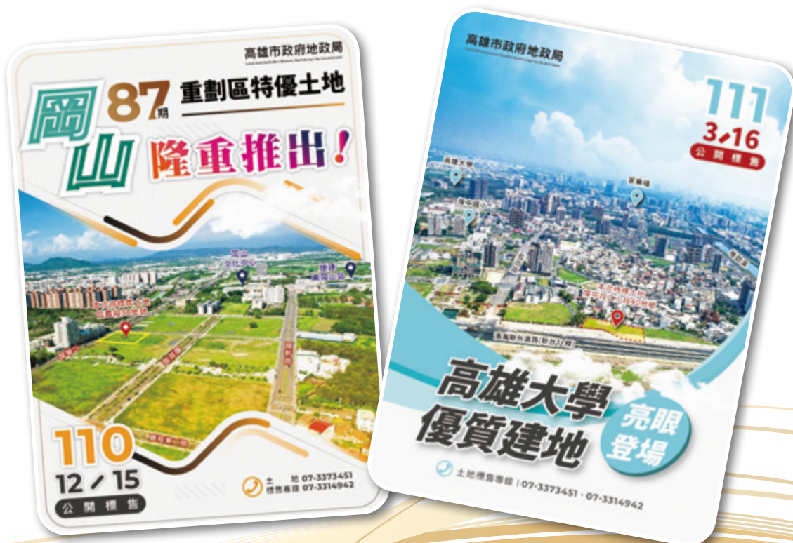
▲ 岡山 87 期公開標售採用空拍圖展現地貌