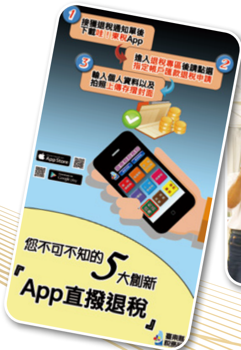
▲ APP 直撥退稅

運用「開放」、「整合」、「創新」方程式，獨創關鍵 Know-how，建置「稅務行動化智能服務平台」，首創全面免附「房屋稅籍證明」、「數位退稅免出門」及「最便利代收稅款處」，簡化繁複流程，廣獲民眾正向回饋，分享至許多縣市政府之稅務及地政機關學習，並榮獲 2021 年智慧城市創新應用獎殊榮。