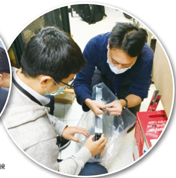
▲ 圖資管理系統主機於 C-P-32 室進行架設