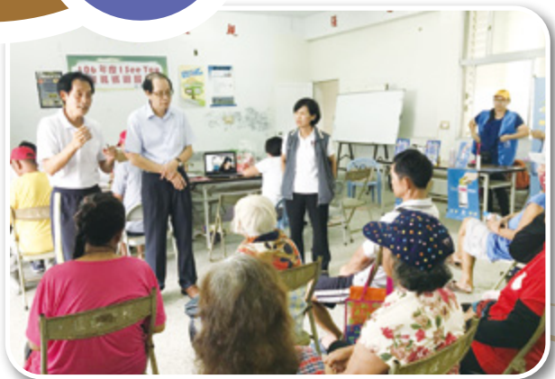
▲ 臺東縣稅務局於離島偏鄉結合國稅局、鄉公所、執行分署、監理站、環保局等提供全方位服務