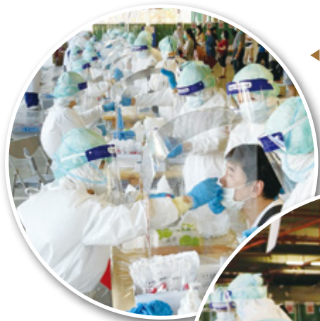
◀ 前進環南市場檢測情形

率先全國針對池化檢驗模式進行科學確效，廣泛應用於公費採檢，完成京元電子以及北農濱江第二果菜市場等戶外千人採檢任務，不但守護臺灣經濟命脈，更減省數億公帑，降低民眾自費篩檢費用，減少民怨，增進公益。