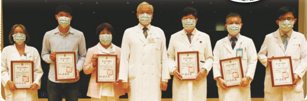
▲ 臺北榮總 111 年廉政楷模