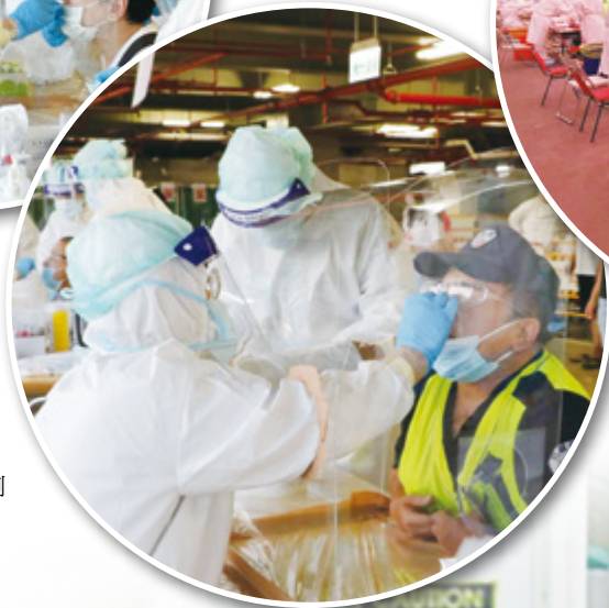
▶ 北農大規模核酸檢測