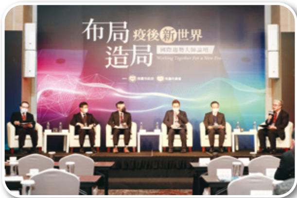
▲ 疫後新世界國際趨勢大師論壇

透過桃園市企業聯繫會議平台，舉辦圖利便民座談會及國際趨勢大師論壇，倡議企業誠信經營及社會責任，協助私部門推動反貪腐工作，績效卓著；有助機關獲致清廉度正面評價。