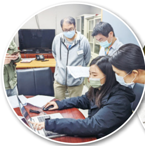
▲ 施工管理平臺資安作為及系統災難復原演練