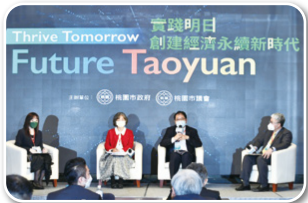
▲ 實踐明日創建經濟永續新時代國際趨勢大師論壇