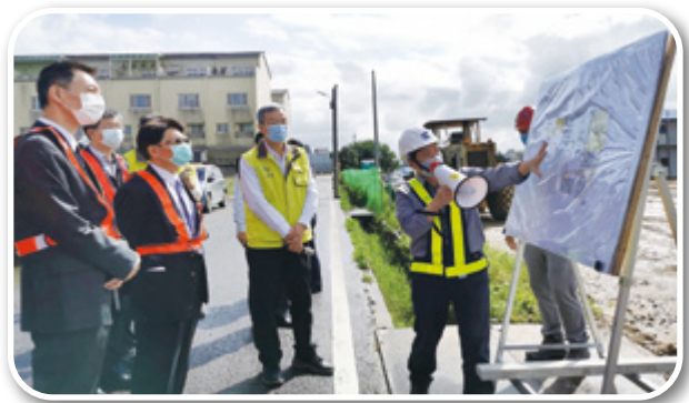
▲ 檢調機關參訪桃機公司第三航站區工程施工區