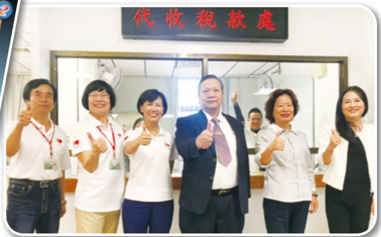
▲ 最便利代收稅款處