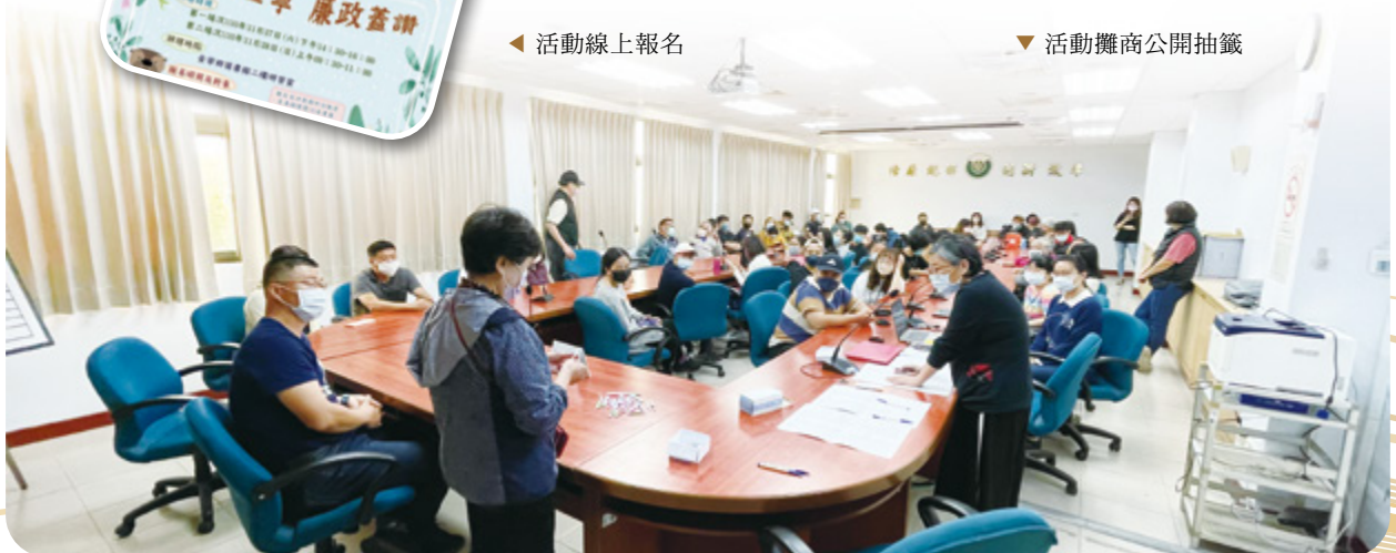
▼ 活動攤商公開抽籤