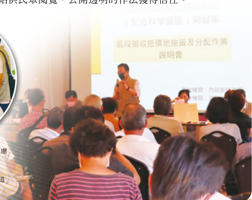
▶ 辦理說明會建立與民眾對話管道