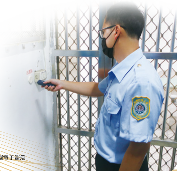
▶ 首創矯正機關電子簽巡