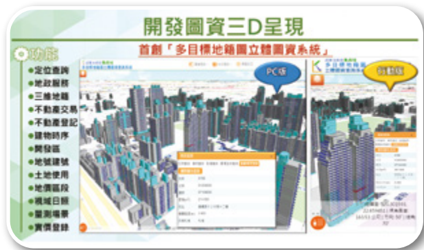
▲ 揭示三維空間權屬資訊 保障民眾權利