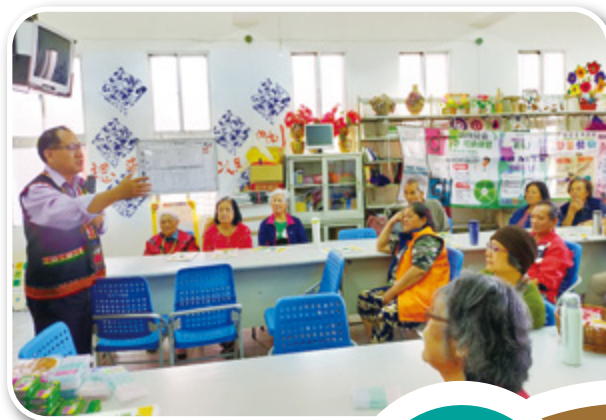
▲ 文健站輔導員以母語協助翻譯解說輔導申辦減免、收稅

體恤民眾因幅員廣、離島遠、交通不便的洽公困境，透過數位創新，主動整合中央地方相關機關，透過公私協力巡迴偏村、離島，提供全能化服務，平衡洽公落差，並獲致高度信任與滿意。