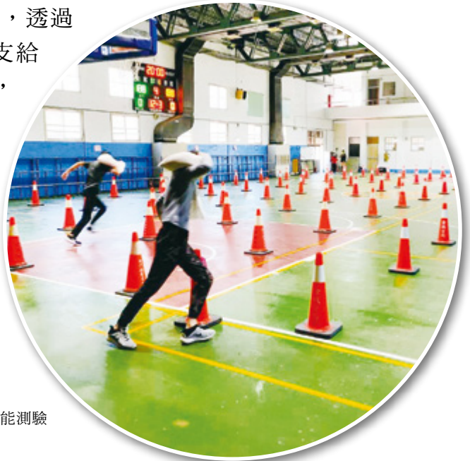
▶ 清潔隊招考體能測驗