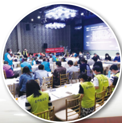
◀ 宣導回饋金使用應注意事項

定期或即時公開更新網頁專區，例如：公用事業回饋金執行經費、市場攤商溝通、產業需地媒合，以及產業園區開發等產業發展事項，簡化網頁操作申請流程，增加民眾參與度，以提升廉潔意識及降低廉政風險。