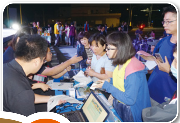
▲ 在夜市活動現場行動稅務服務