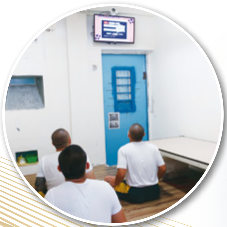
▲ 間間是教室 處處可學習

經由風險辨識及危機處理，首創舍房電子簽巡、建置校園安全地圖、精進採購及勤務制度，並推動電子聯絡簿、行動接見、官方 LINE、教學成果發表、懇親會等溝通管道，有效減少民怨；建立遠距教學系統，達到「間間是教室，處處可學習」。