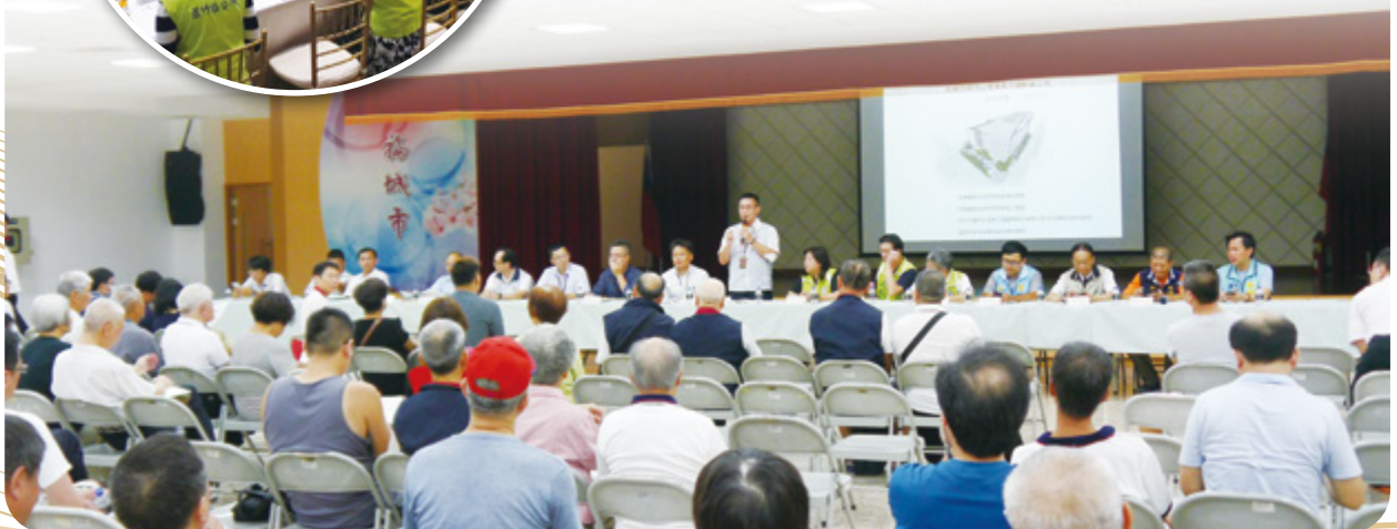
▼ 市場攤商安攤說明會