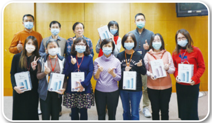
▲ 局務會議頒發予點子王提案人與執行人

創新設置「點子王」制度，鼓勵同仁創新發想，主動發掘民怨提案解決。有效簡化流程、透明資訊、強化便民服務與廉能作為，提升徵納雙方信任度，形塑創新、便民、智能、透明之廉能組織文化。