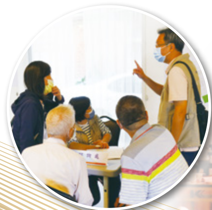
▲ 提供專人諮詢服務 解除民眾疑慮

土地開發過程中藉由辦理各類型公開會議及專人諮詢服務等，建立多元對話管道，傾聽民意，增加民眾參與度；土地開發審議過程和開發進度，以及開發成果等資訊，全部揭露於公開網站供民眾閱覽，公開透明的作法獲得信任。