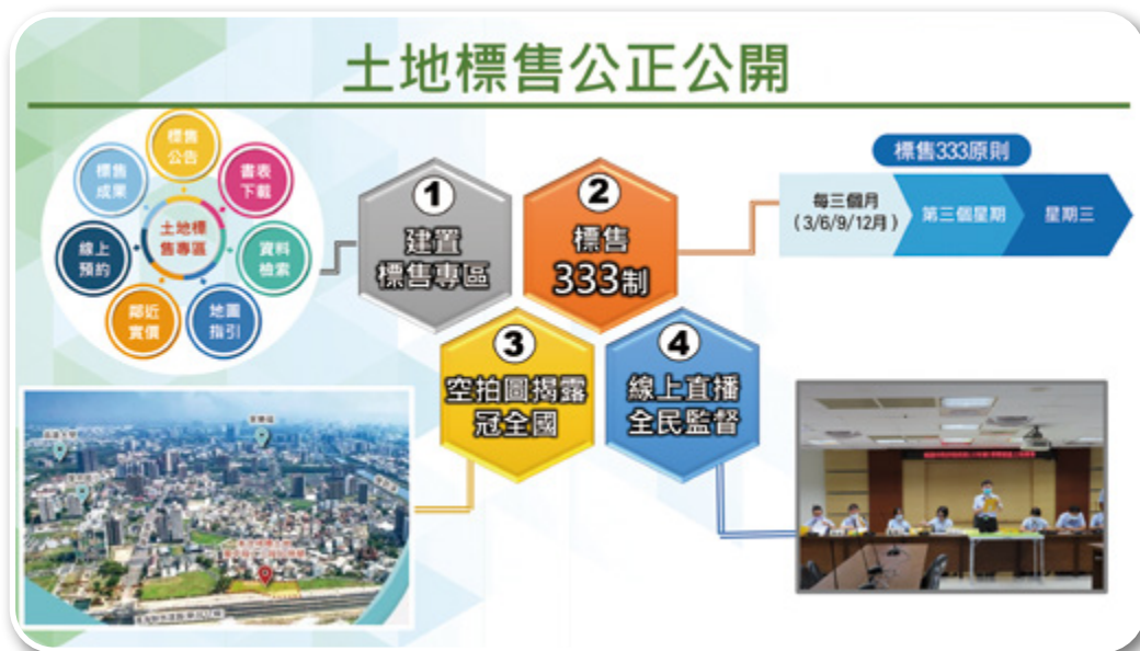
▲ 土地標售公正公開

首創大量採用空拍圖標示土地標售案，展現完整地貌、鄰地現狀，標售網頁專區提供標售土地詳細資料，與鄰近實價登錄等充分資訊揭露，以全程直播標售過程落實全民監督，土地標售公開、公正、公平。