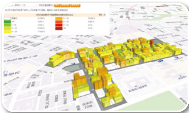
▲ 三維地籍立體圖資揭示開發區已登記建物屋齡

首創「多目標地籍圖立體圖資系統」，以「三維地籍建物模型」展現城市開發的短、中、長程效益與發展軌跡，揭示「三維空間」權屬資訊，並結合不動產實價登錄資訊，以達資訊公開，充分保障土地使用權利與減少糾紛，地政開放資訊達486項資料集，為全國之冠。