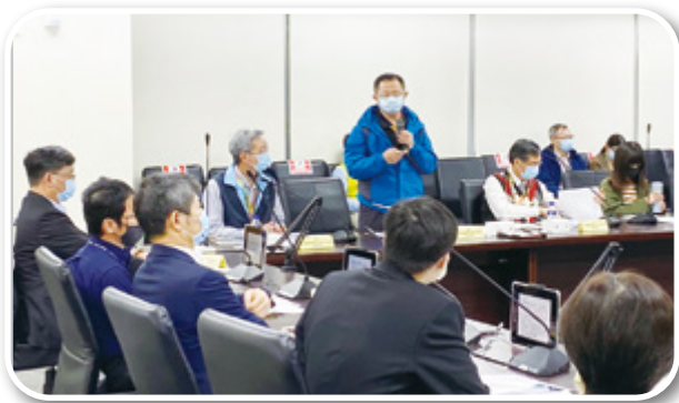
▲ 第三航站區建設計畫廉政平臺第 10 次聯繫會議