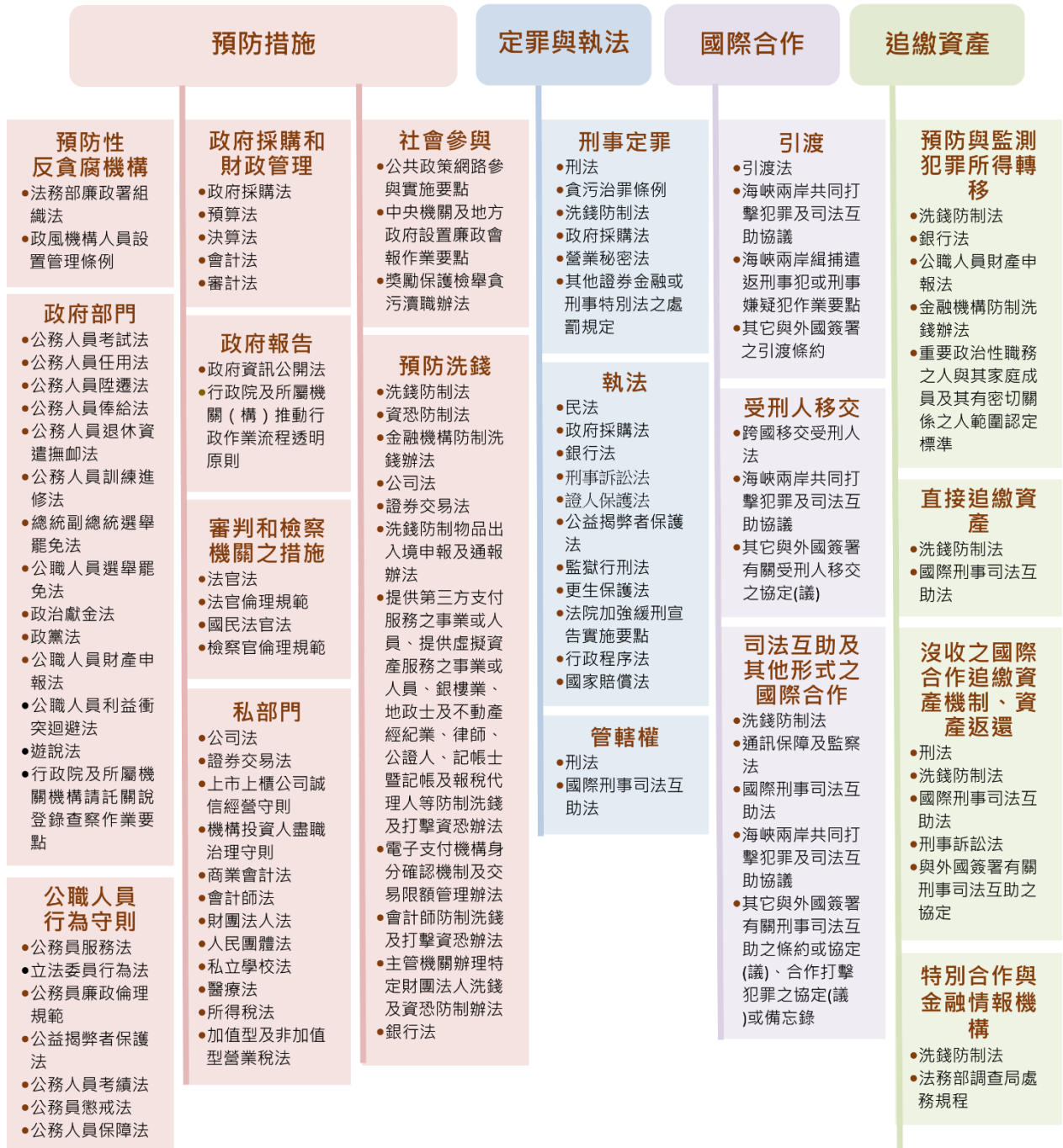
圖 1-1 我國反貪腐法制架構