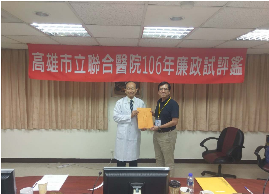
圖 4.30 高雄市立聯合醫院訪視評鑑活動照片（一）