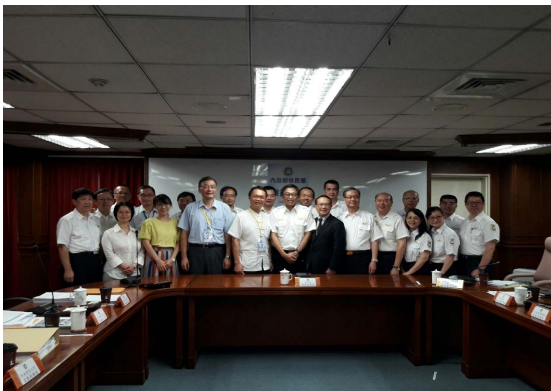
圖 4.16 內政部移民署訪視評鑑活動照片（一）