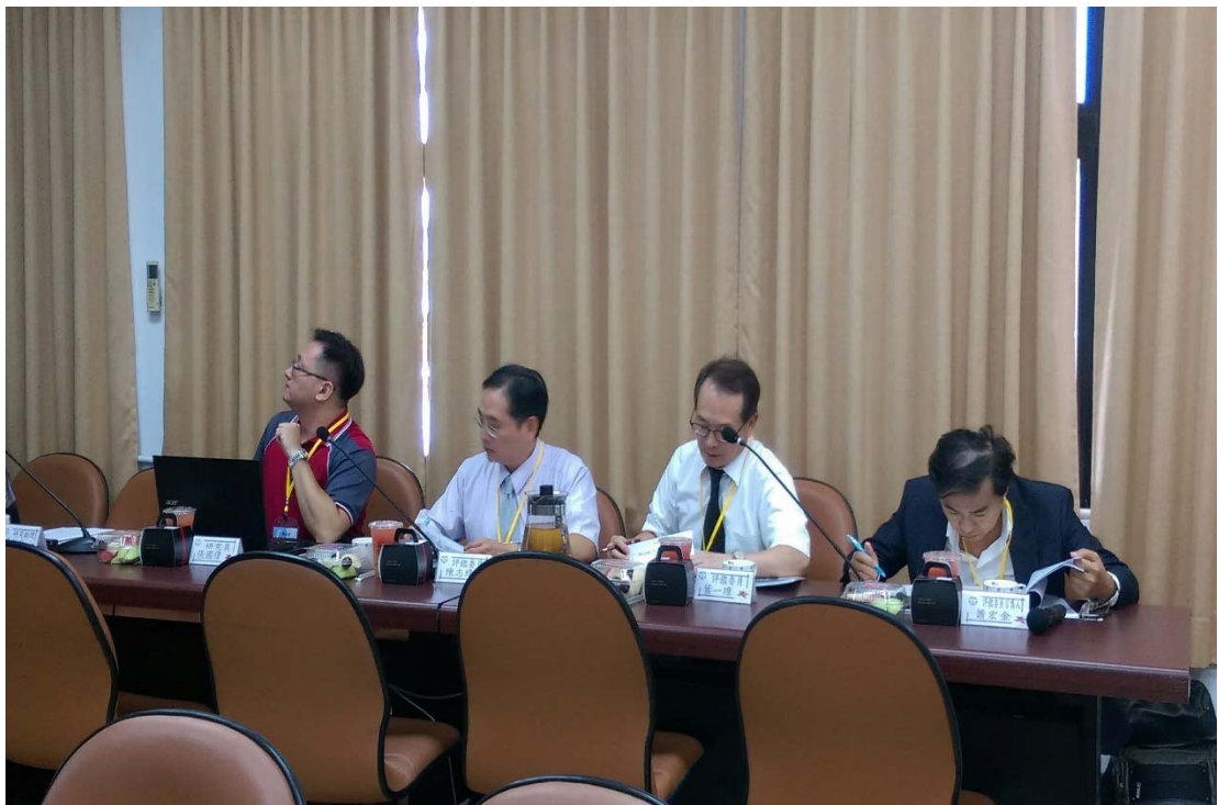
圖 4.43 嘉義市政府稅務局訪視評鑑活動照片（二）