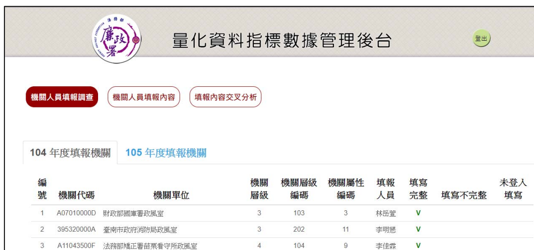
圖 2.1 審閱機關填報情形之後台網頁