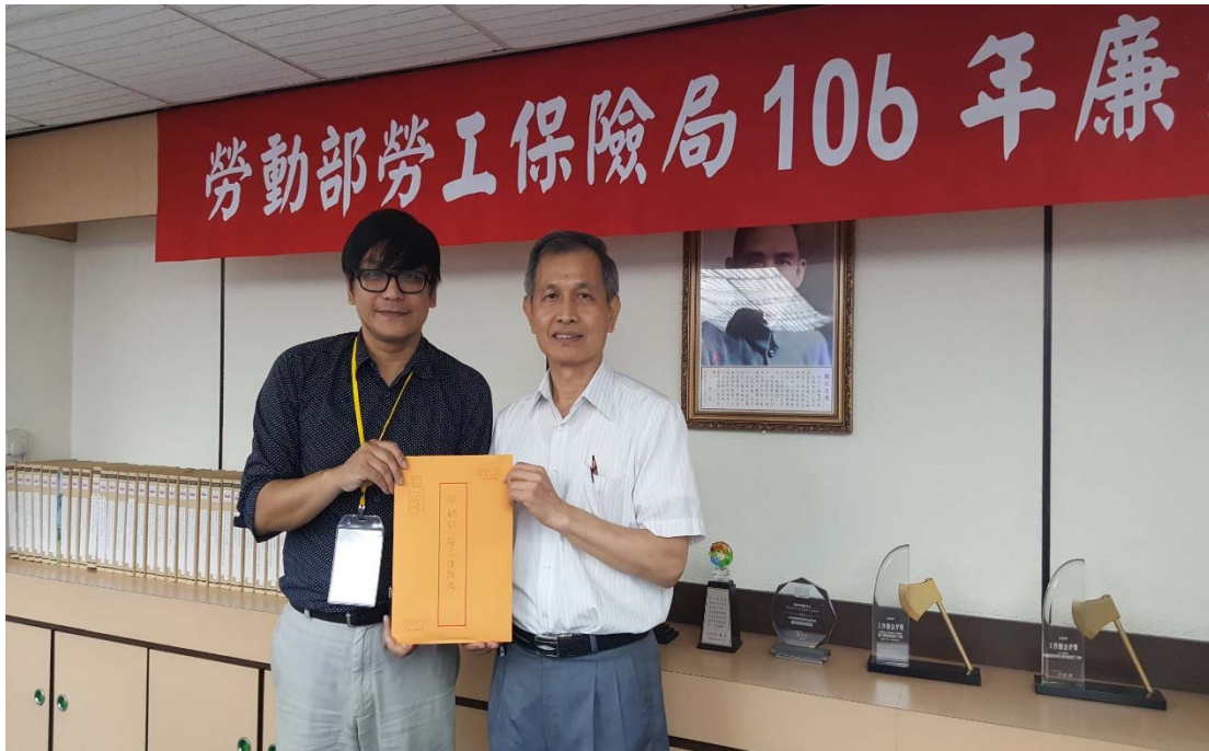
圖 4.22 勞動部勞工保險局訪視評鑑活動照片（一）