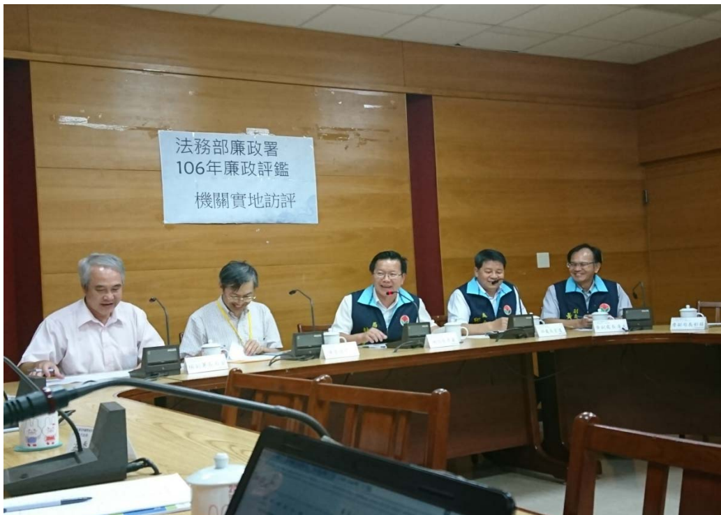
圖 4.5 苗栗縣政府文化觀光局訪視評鑑活動照片（二）