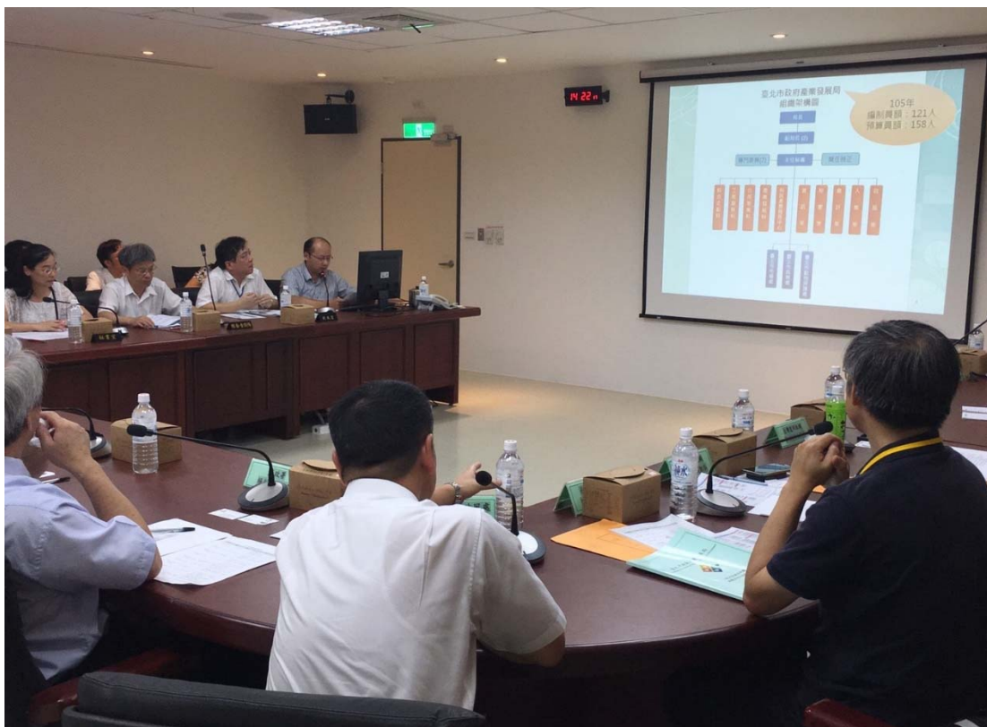
圖 4.21 臺北市政府產業發展局訪視評鑑活動照片 (二)