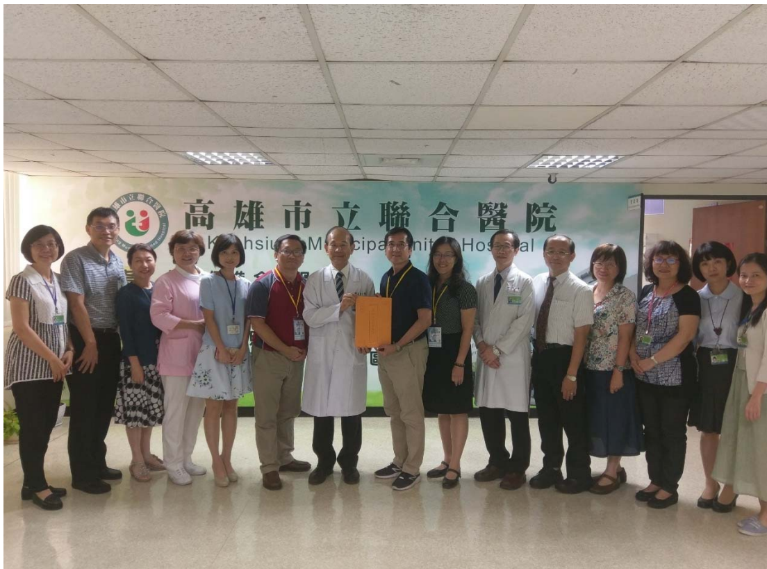
圖 4.31 高雄市立聯合醫院訪視評鑑活動照片（二）