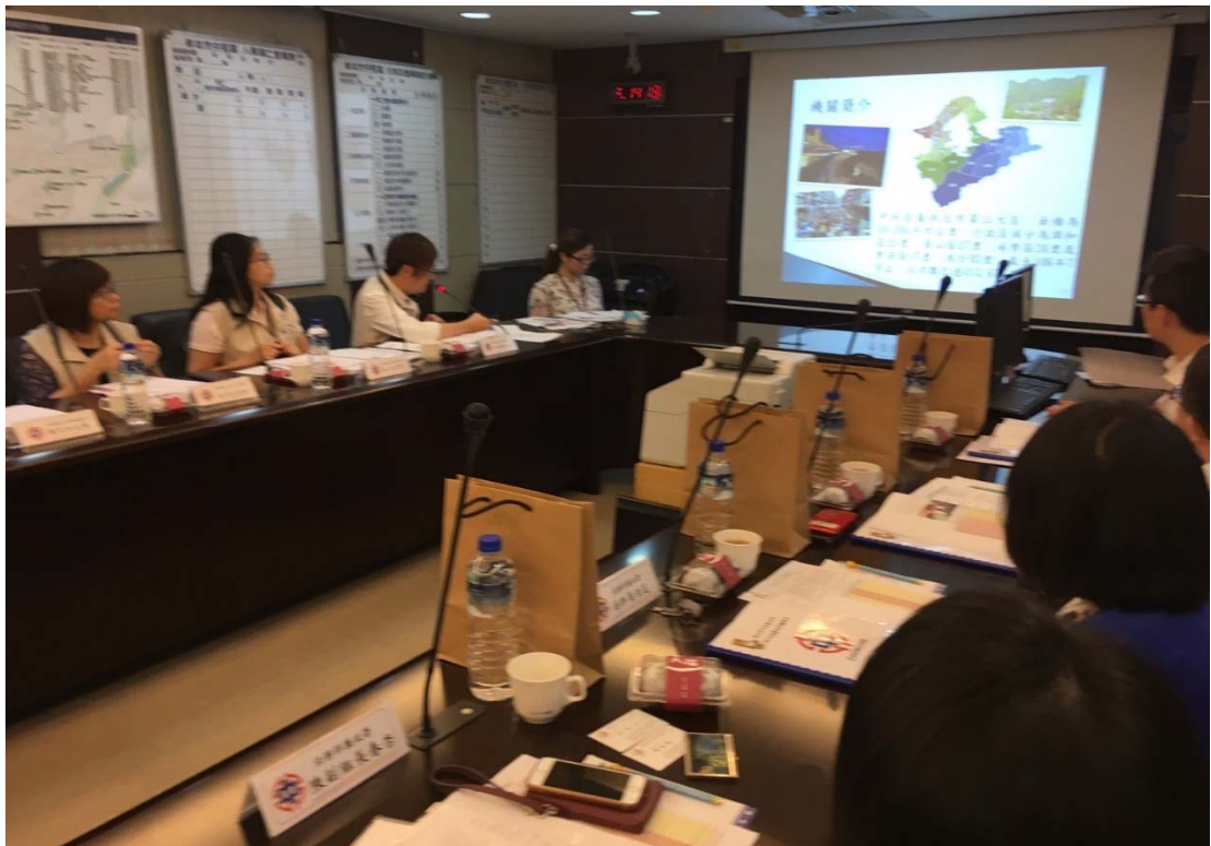
圖 4.41 新北市中和區公所訪視評鑑活動照片（二）