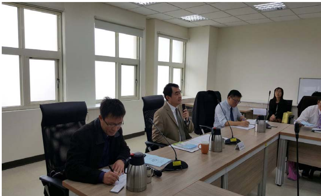
圖 4.1 評鑑工作說明會活動照片（一）