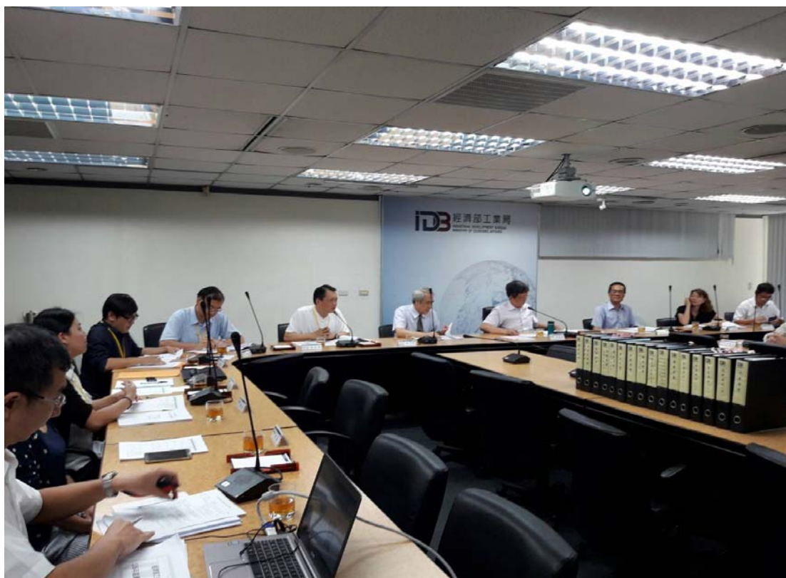
圖 4.19 經濟部工業局訪視評鑑活動照片 (二)