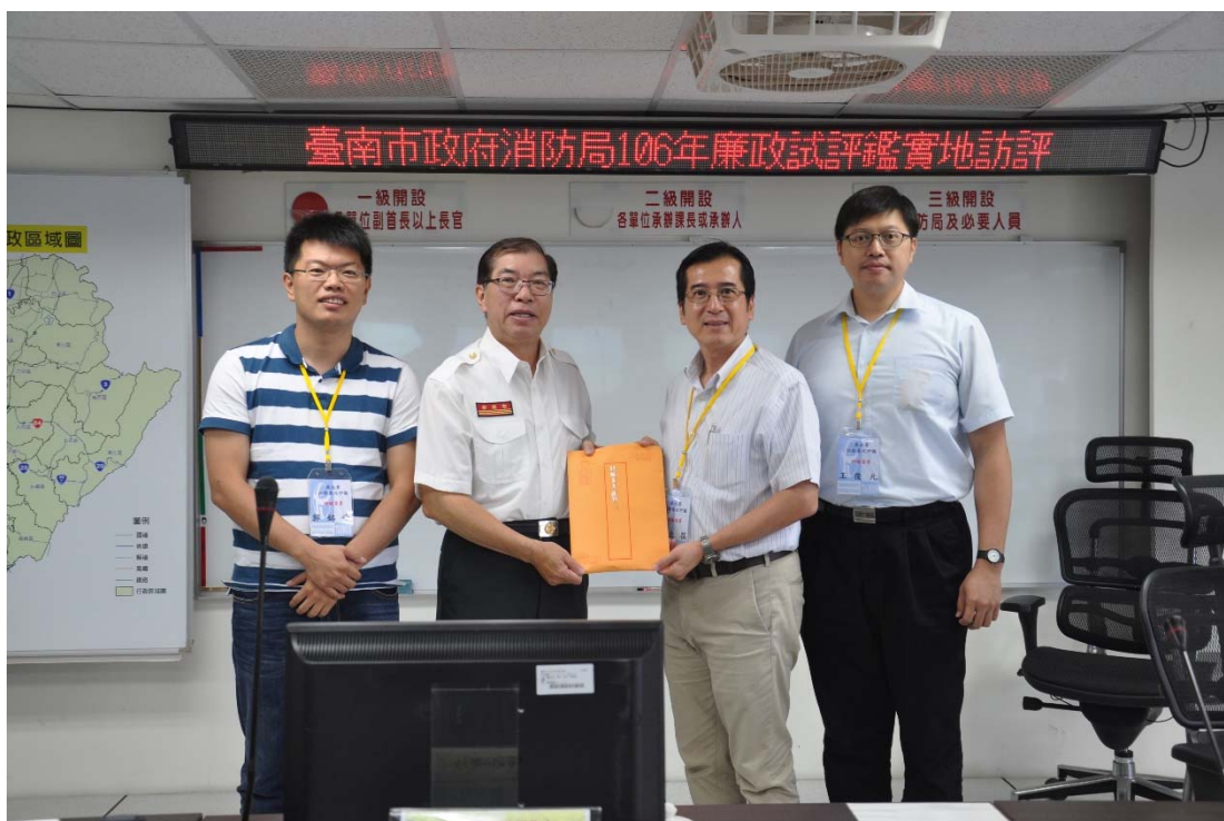
圖 4.26 臺南市政府消防局訪視評鑑活動照片 (一)