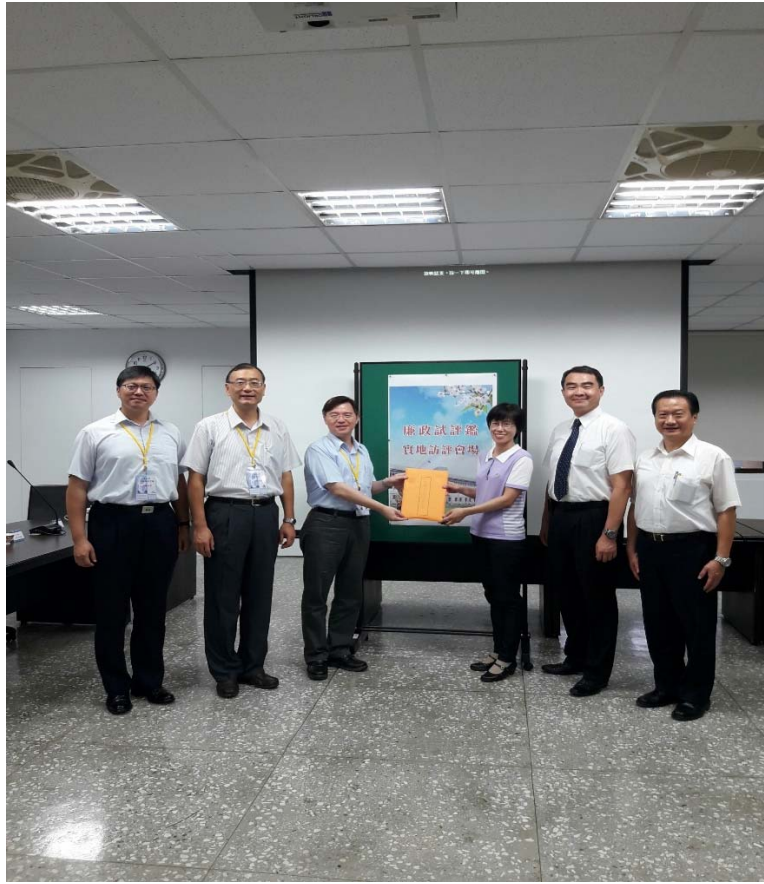
圖 4.14 宜蘭縣政府地方稅務局訪視評鑑活動照片（一）