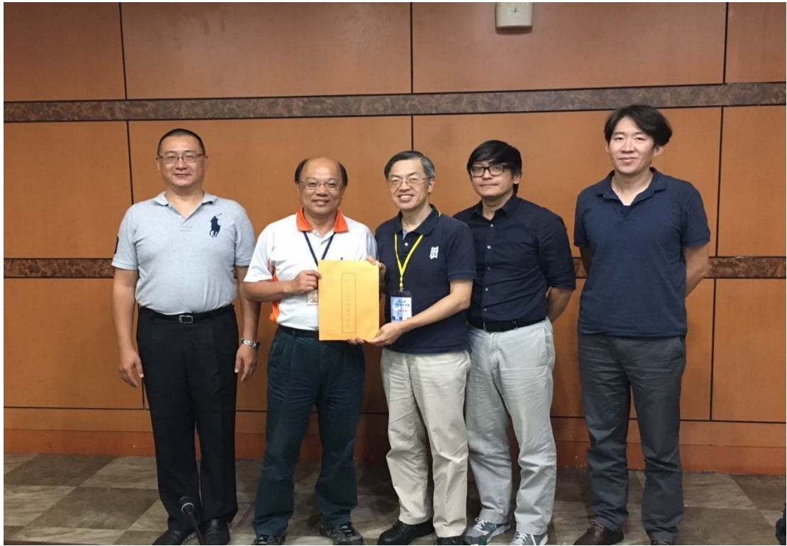
圖 4.38 新北市政府環境保護局訪視評鑑活動照片（一）