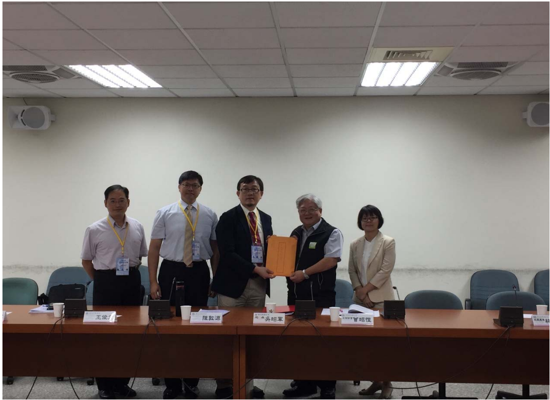
圖 4.10 雲林縣衛生局訪視評鑑活動照片 (一)