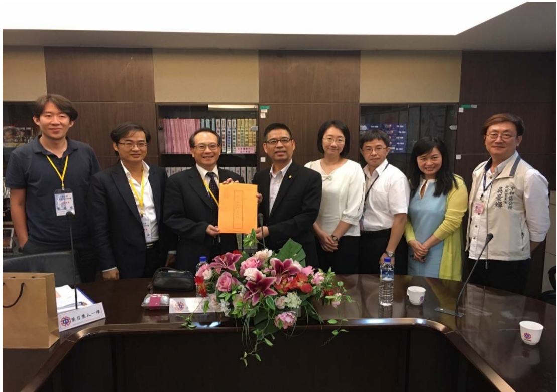
圖 4.40 新北市中和區公所訪視評鑑活動照片（一）