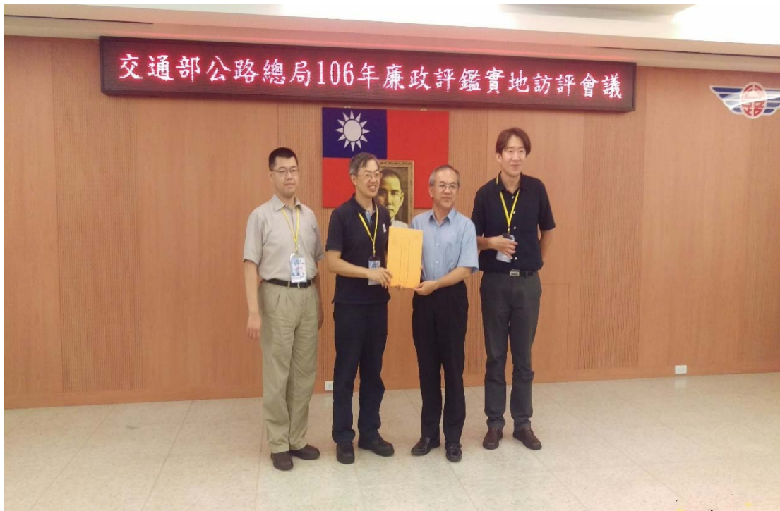
圖 4.36 交通部公路總局訪視評鑑活動照片 (一)