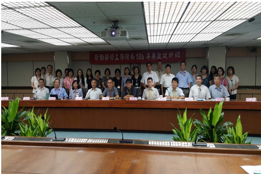
圖 4.23 勞動部勞工保險局訪視評鑑活動照片（二）