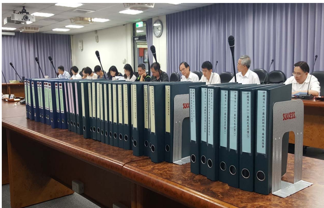
圖 4.25 財政部國有財產署訪視評鑑活動照片 (二)