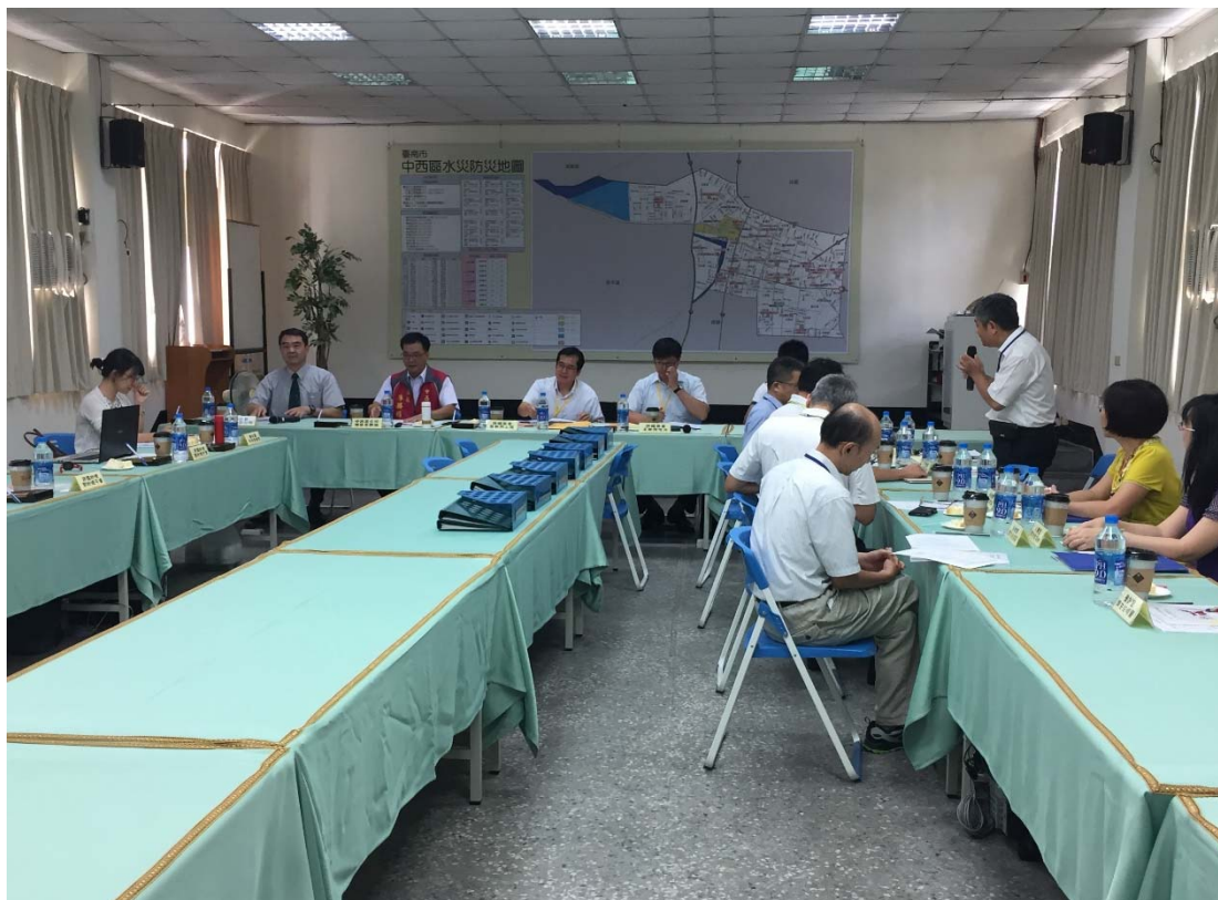
圖 4.29 臺南市中西區公所訪視評鑑活動照片（二）