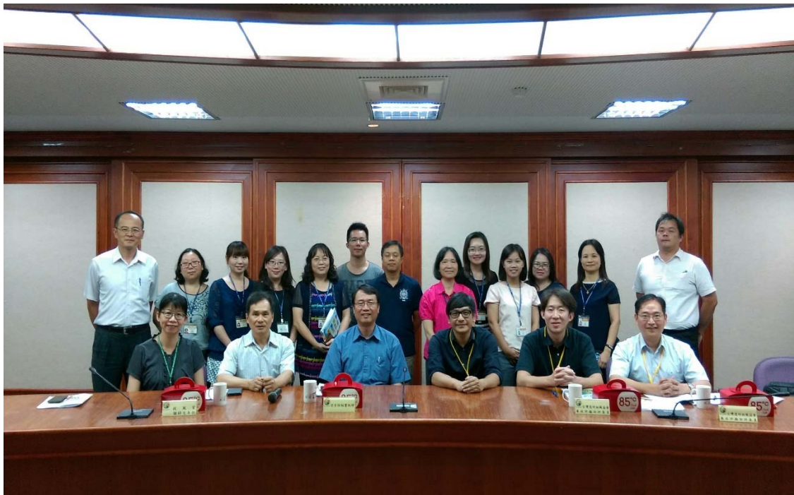
圖 4.9 臺中市政府教育局訪視評鑑活動照片（二）