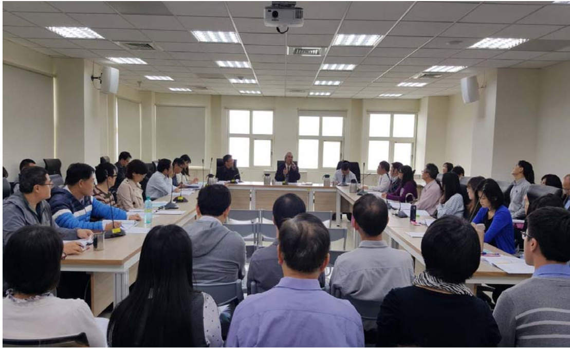
圖 4.2 評鑑工作說明會活動照片(二)