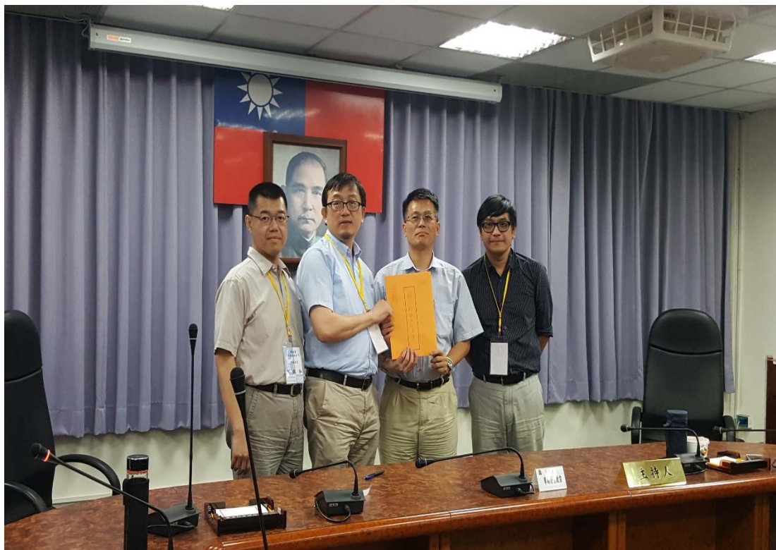
圖 4.24 財政部國有財產署訪視評鑑活動照片 (一)