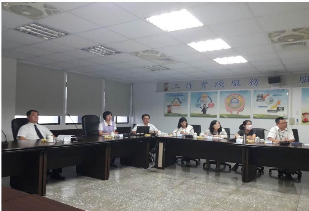
圖 4.15 宜蘭縣政府地方稅務局訪視評鑑活動照片（二）