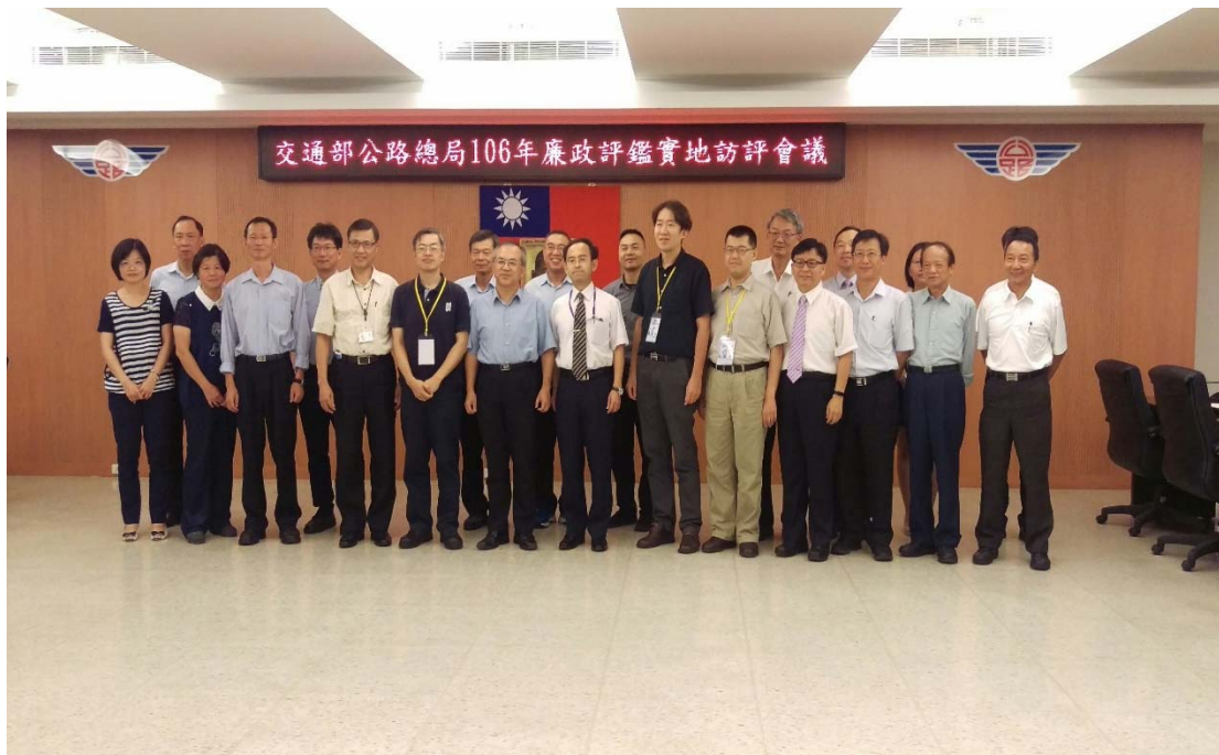
圖 4.37 交通部公路總局訪視評鑑活動照片 (二)