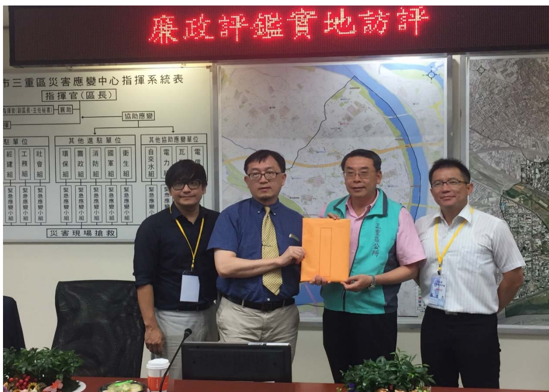
圖 4.34 新北市三重區公所訪視評鑑活動照片 (一)