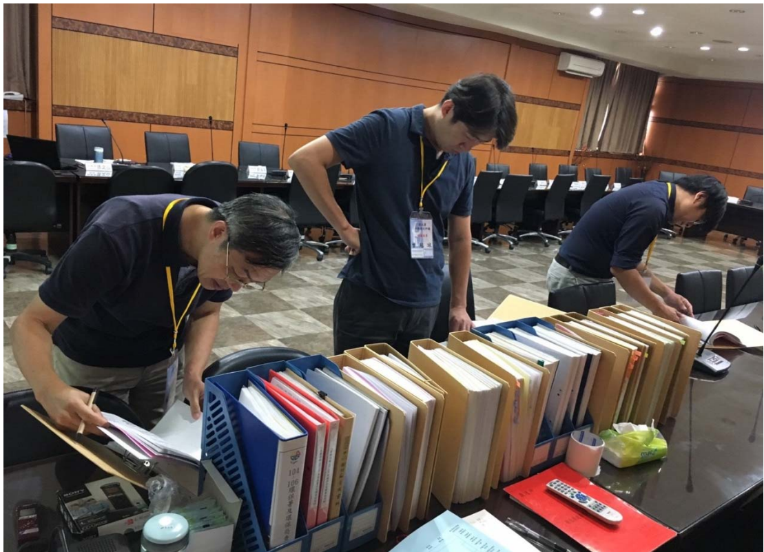
圖 4.39 新北市政府環境保護局訪視評鑑活動照片（二）