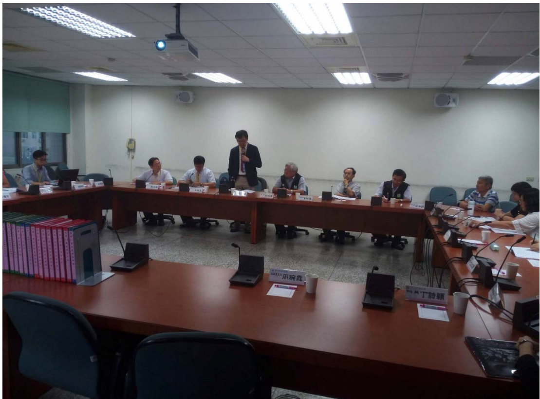
圖 4.11 雲林縣衛生局訪視評鑑活動照片 (二)