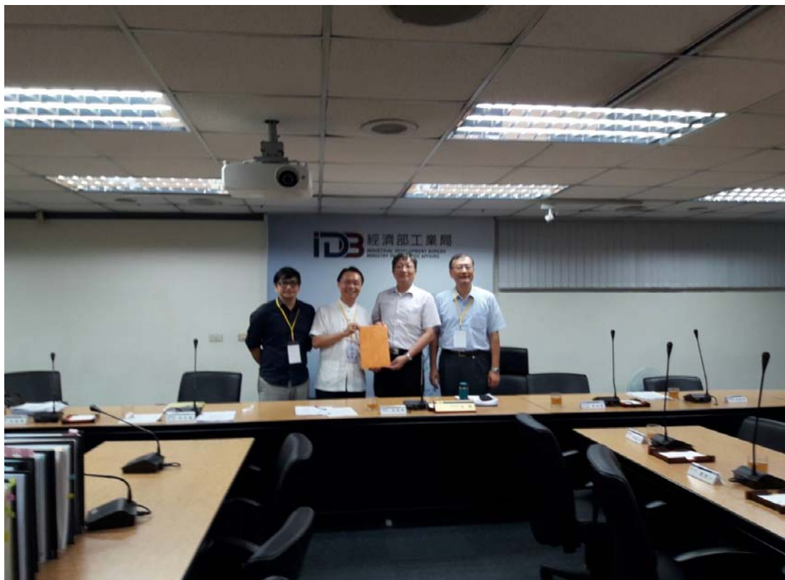
圖 4.18 經濟部工業局訪視評鑑活動照片 (一)