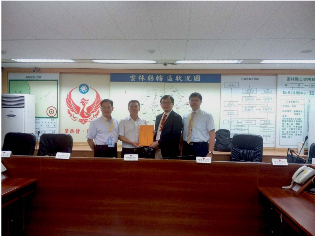
圖 4.12 雲林縣消防局訪視評鑑活動照片（一）