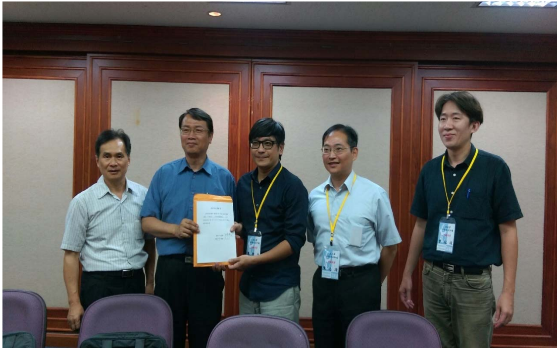
圖 4.8 臺中市政府教育局訪視評鑑活動照片（一）