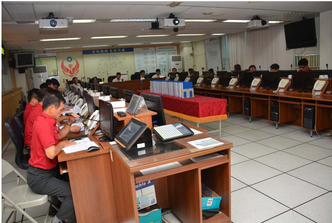
圖 4.13 雲林縣消防局訪視評鑑活動照片（二）