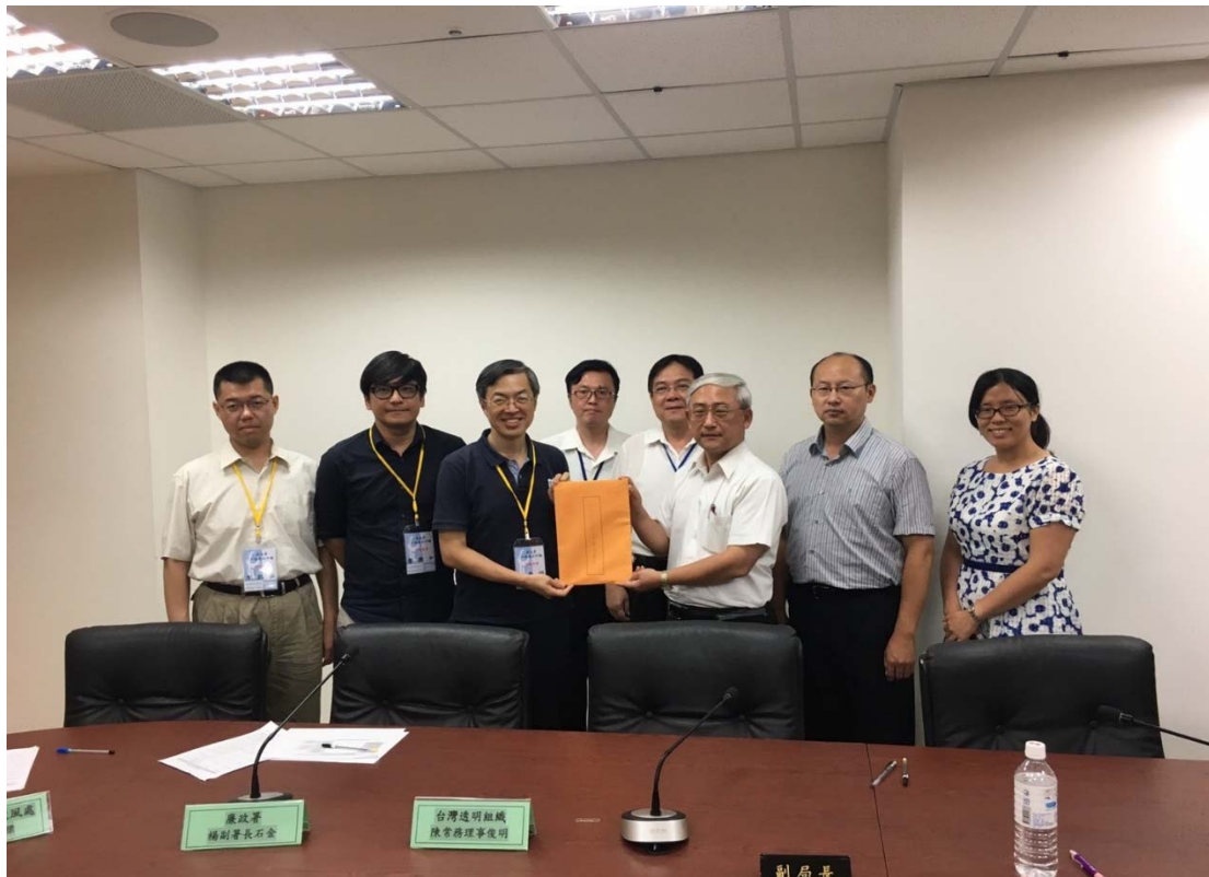
圖 4.20 臺北市政府產業發展局訪視評鑑活動照片 (一)