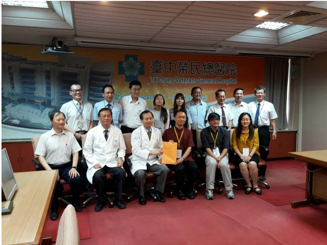
圖 4.6 臺中榮民總醫院訪視評鑑活動照片 (一)