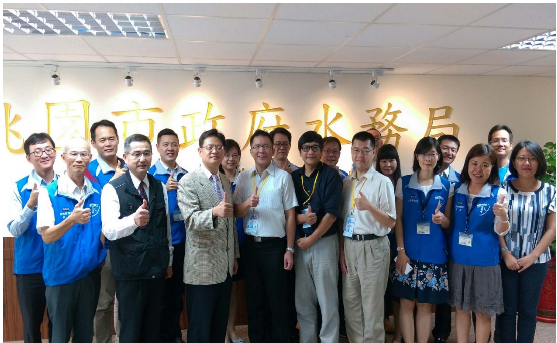
圖 4.33 桃園市政府水務局訪視評鑑活動照片（二）