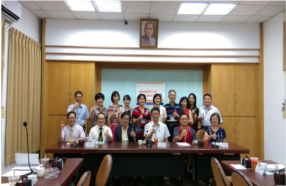
圖 4.42 嘉義市政府稅務局訪視評鑑活動照片（一）