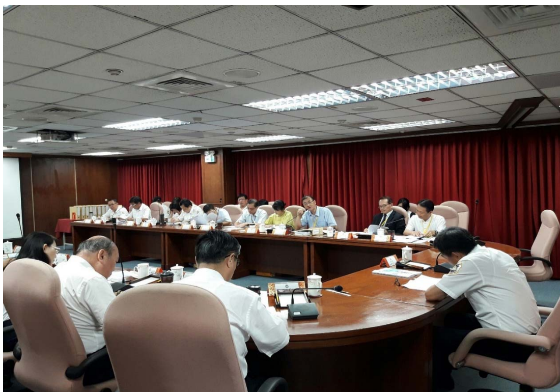
圖 4.17 內政部移民署訪視評鑑活動照片（二）