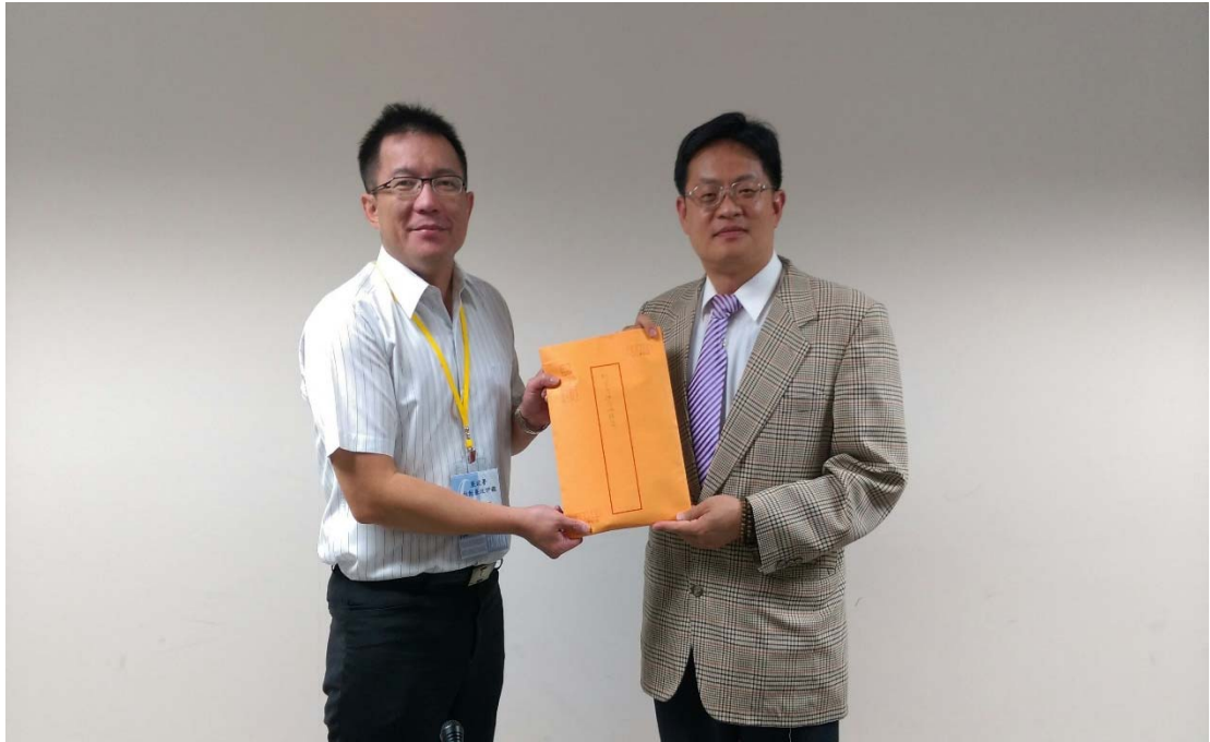
圖 4.32 桃園市政府水務局訪視評鑑活動照片（一）