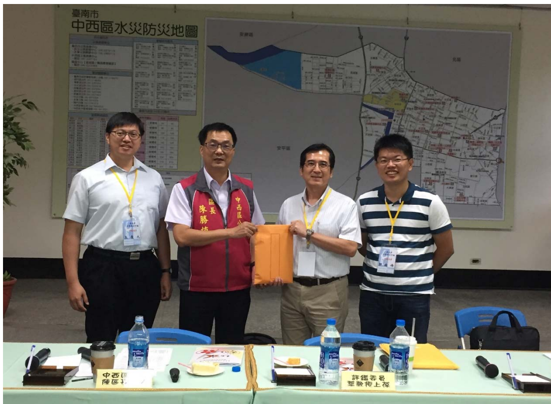
圖 4.28 臺南市中西區公所訪視評鑑活動照片（一）