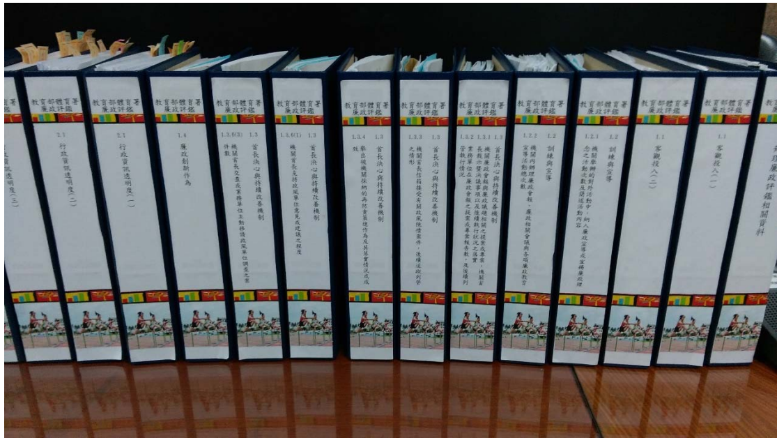
圖 4.3 書面佐證資料整理範例

機關自我評鑑報告格式建議可採 14 號標楷字體、固定行高 25 點；簡易內容範例，如下表 4.10 所示；而詳細的機關自我評鑑報告範本則可參閱附錄一。試評機關之自評報告預計於 106 年 7 月 17 日之前完成，將自評報告電子檔 E-mail 並印製紙本一式 5 份送至法務部廉政署承辦科，再由本研究團隊轉送給評鑑委員進行檢閱，以作為下一階段進行實地訪視評鑑之基礎。