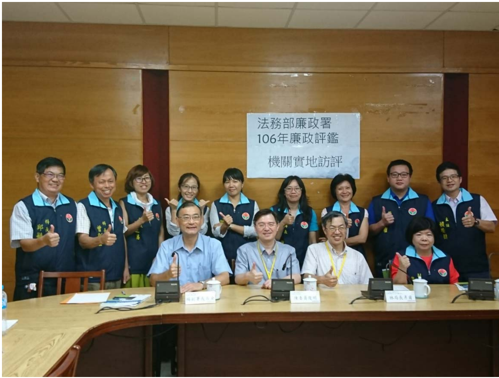
圖 4.4 苗栗縣政府文化觀光局訪視評鑑活動照片（一）