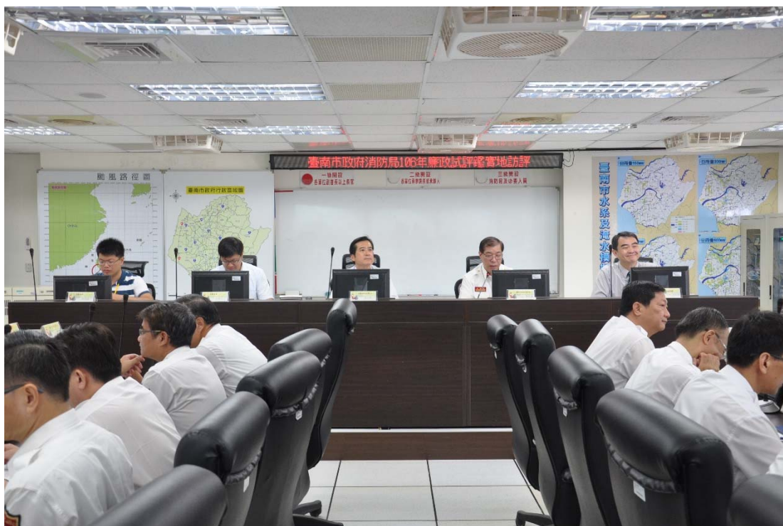
圖 4.27 臺南市政府消防局訪視評鑑活動照片 (二)