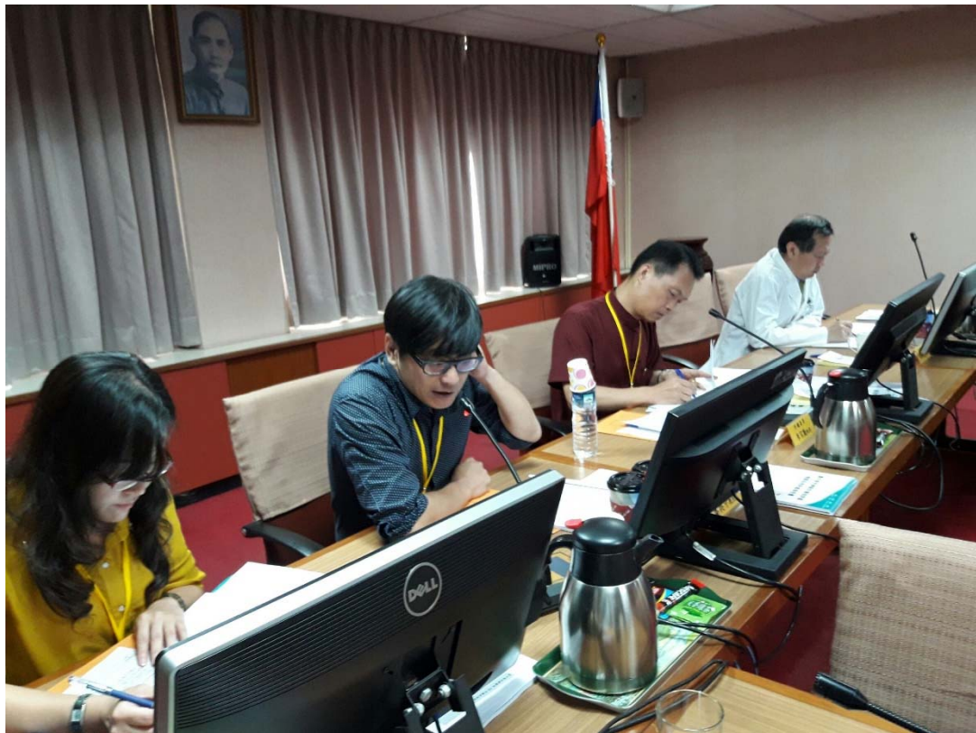
圖 4.7 臺中榮民總醫院訪視評鑑活動照片 (二)