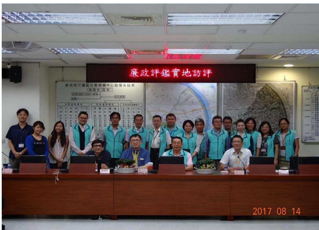
圖 4.35 新北市三重區公所訪視評鑑活動照片 (二)